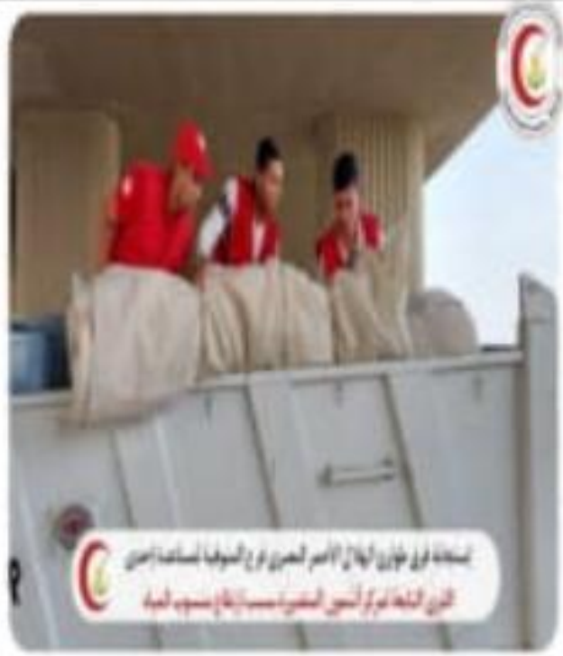
استجابة فريق طوارئ الهلال الأحمر المصري فرع المنيا لمساعدة إحدى القرى النائية لمركز أئمة المنيا - إقطاع منسوب المياه