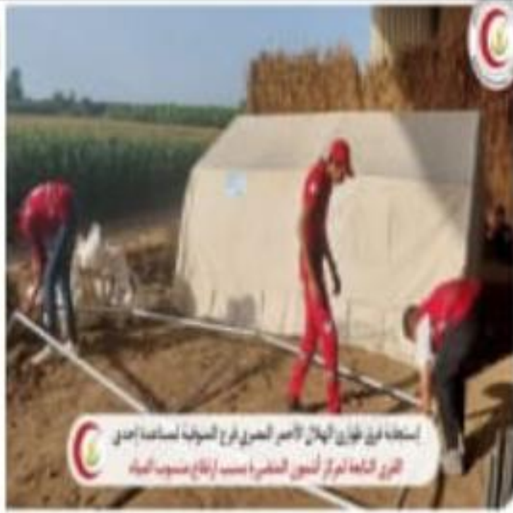
استجابة فريق طوارئ الهلال الأحمر المصري فرع المنيا لمساعدة إحدى القرى النائية لمركز أئمة المنيا - إقطاع منسوب المياه