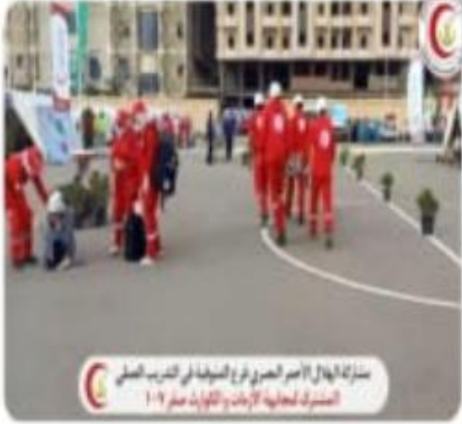
مشاركة الهلال الأحمر المصري فرع المنوفية في التدريب العملي المشترك لمعالجة الأزمات والكوارث صفر ١٠٧