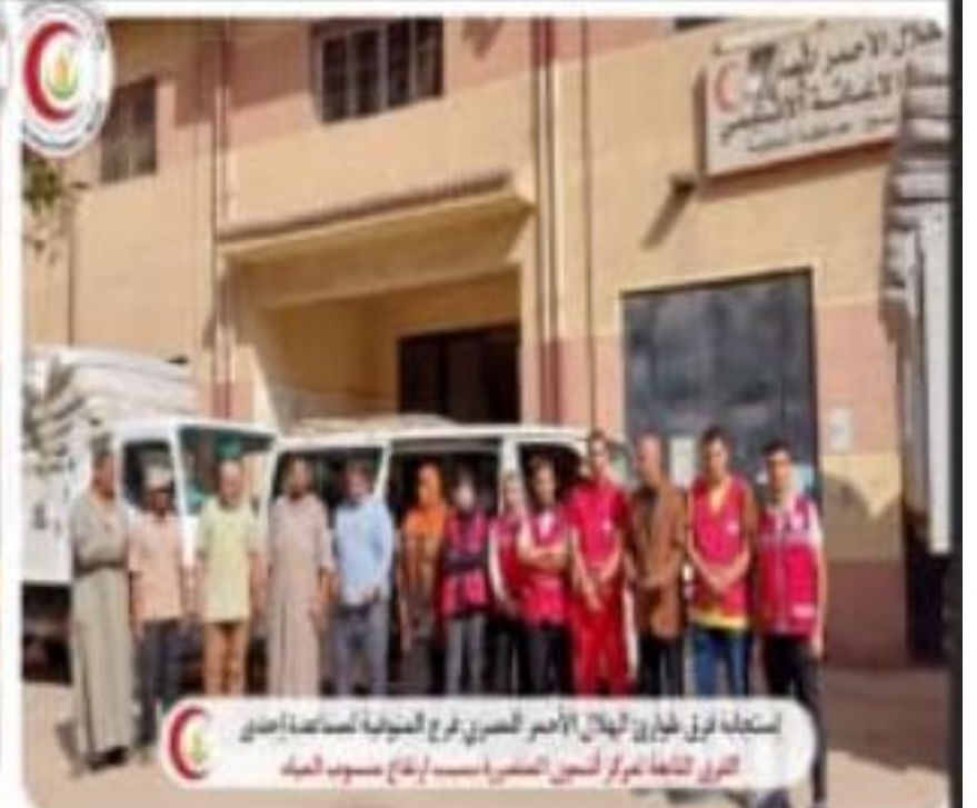
استجابة فريق طوارئ الهلال الأحمر المصري فرع المنيا لمساعدة إحدى القرى النائية لمركز أئمة المنيا - إقطاع منسوب المياه

في إستجابة سريعة من الهلال الأحمر المصري؛ قامت فرق الإستجابة للطوارئ بفرع المنوفية بتلبية عاجلة لتداء المحافظة و العمل على توفير خيام مجهزة لمتضرري إحدى قرى مركز أشمون، وذلك بعد إرتفاع مؤقت لمنسوب النيل.. تم ذلك بعد نقل عدد 15 خيمة من مخزن الإغاثة الإقليمي والتعاون مع الجهات المعنية لتخفيف الضرر عن أهالي القرية وتوفير خيام مجهزة وأمنة للمتضررين، حيث قام المتطوعون بنقل الخيام ومن ثم نصبها ثم تجهيزها..