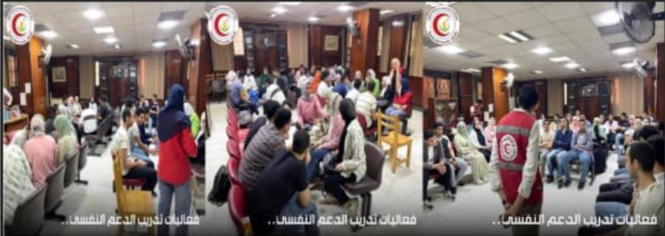
فعاليات تدريب الدعم النفسي..