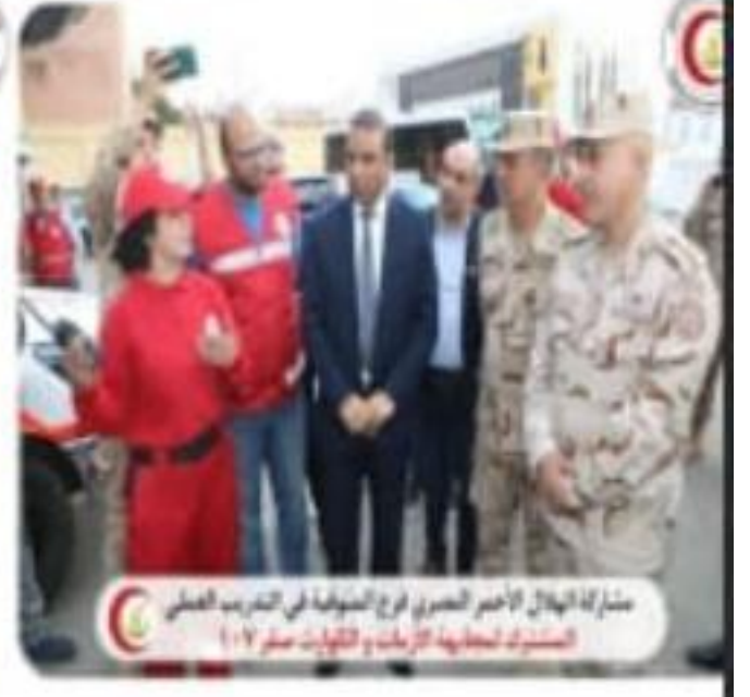
مشاركة الهلال الأحمر المصري فرع المنوفية في التدريب العملي المشترك لمعالجة الأزمات والكوارث صفر ١٠٧