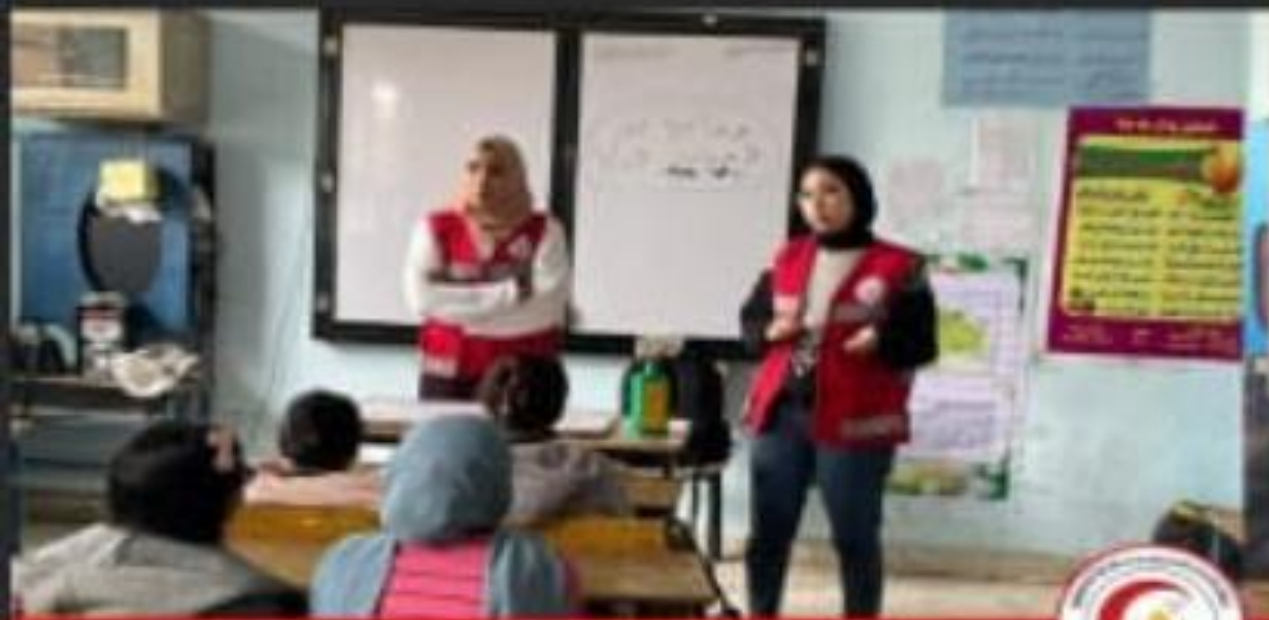
فاعليات تدريب طلاب مدرسة الأحمديّة بشيبن الكوم على مواجهة الطوارئ والإسعافات الأولية