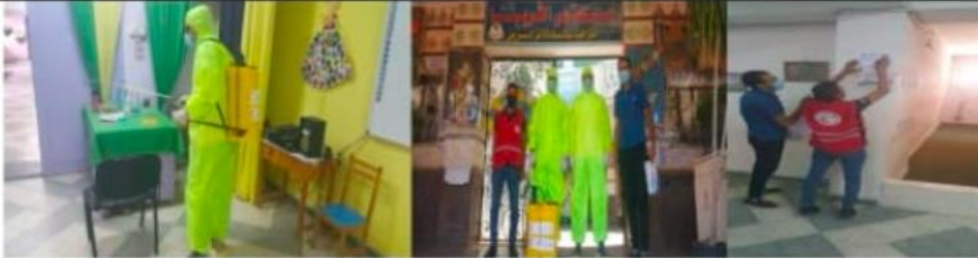
قام امس فريق التطهير والتعقيم بالهلال الأحمر المصري بتطهير مدارس الثريا بشبين الكوم ##الهلال_الأحمر_المصري_بالمنوفية