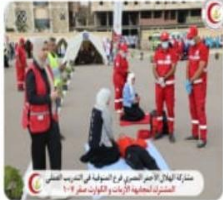
مشاركة الهلال الأحمر المصري فرع المنوفية في التدريب العملي المشترك لمعالجة الأزمات والكوارث صفر ١٠٧