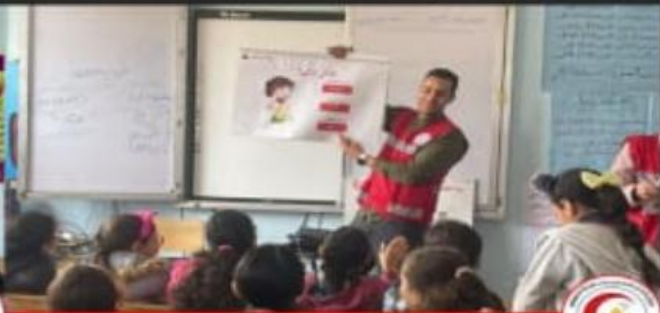
فاعليات تدريب طلاب مدرسة الأحمديّة بشيبن الكوم على مواجهة الطوارئ والإسعافات الأولية